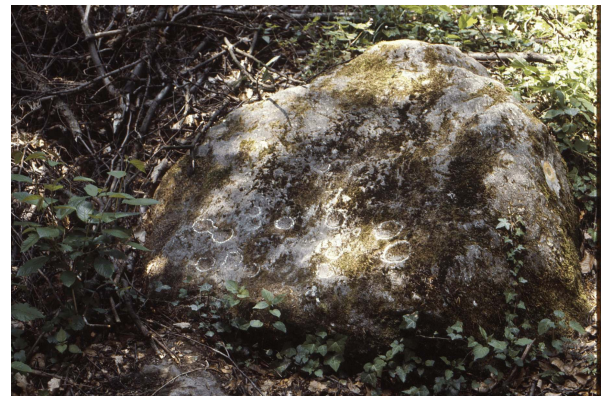
Schalenstein «Chräjeberg II»