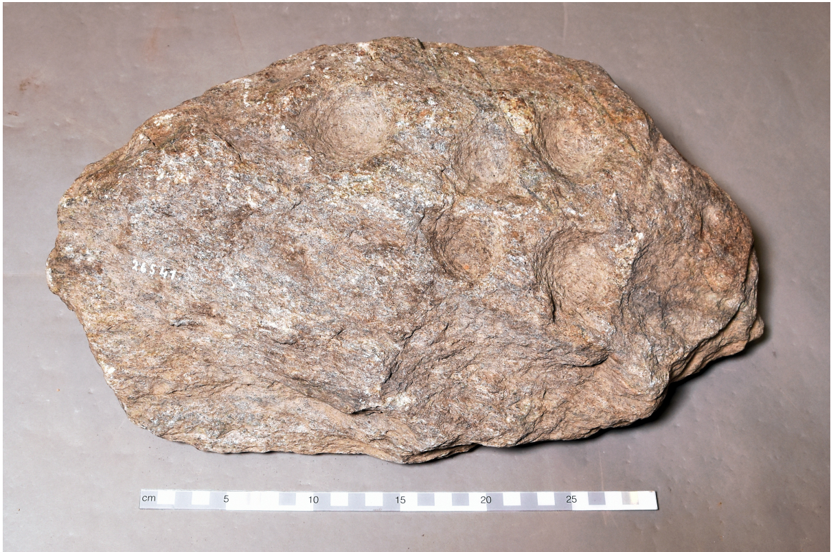
Neues Erkennungsfoto des Bernischen Historischen Museums