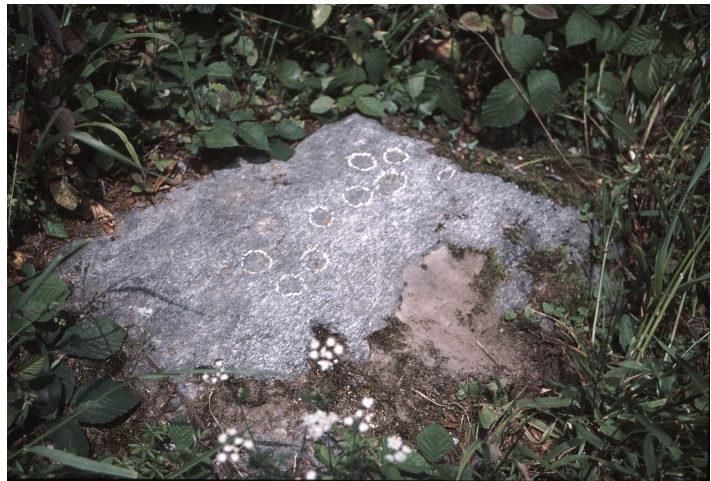
Schalenstein im Ischlag