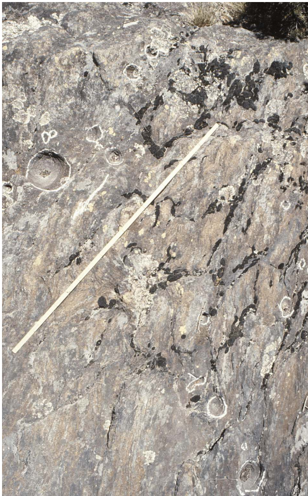
Schalen in der mittleren Partie des südlichen Teilblocks