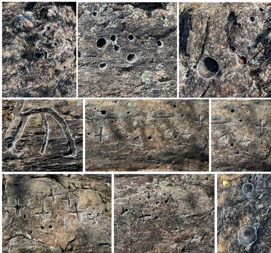
Zusammenstellung einiger Gravierungen des Block 6538.03: Fotos von L. Bettosini 2023.