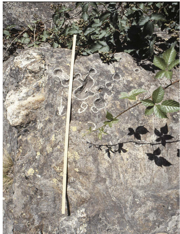
Schalen in der östlichen Partie des südlichen Teilblocks