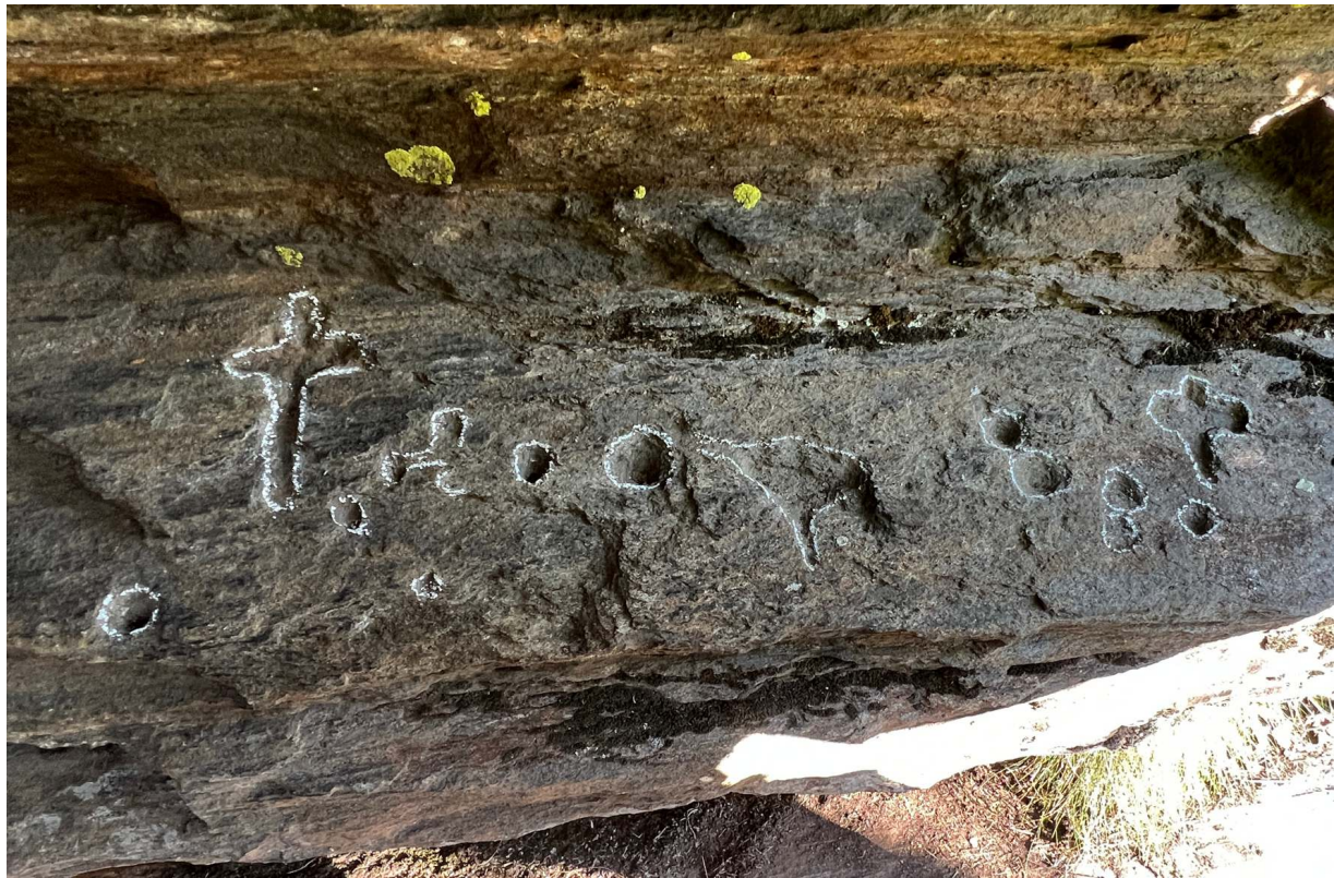
Gravierungen in der Höhle: Foto von L. Bettosini 2023.