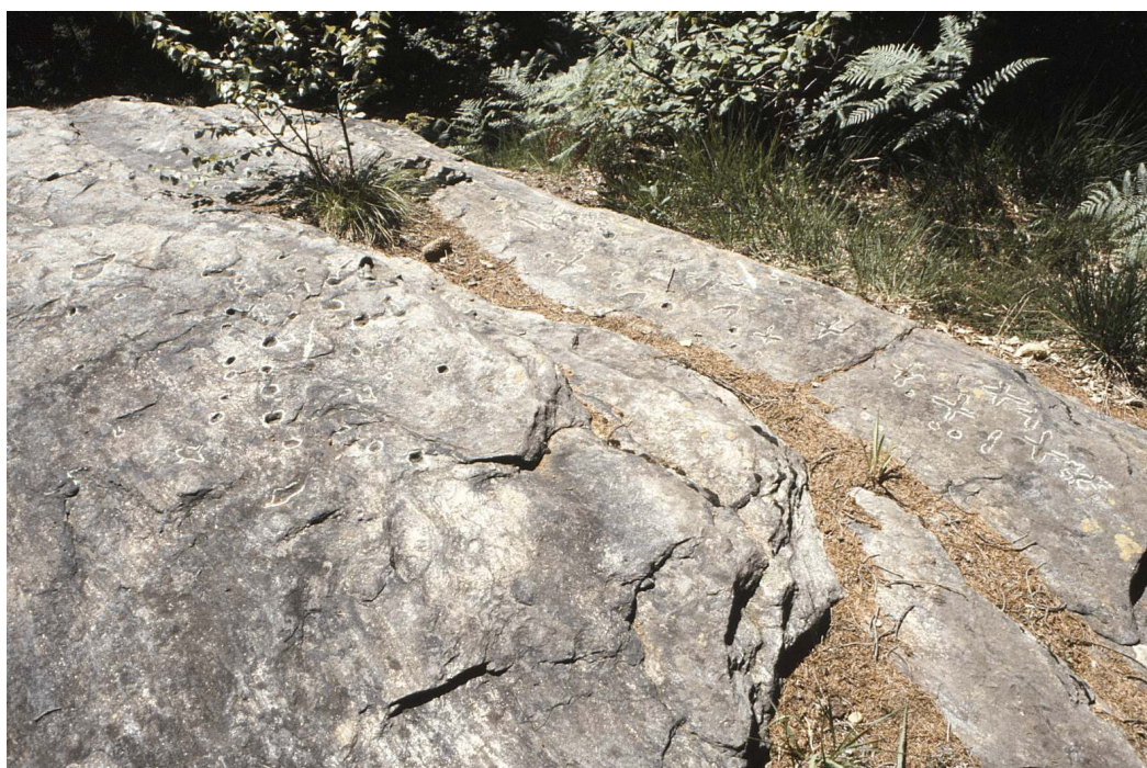
am westl. Rand des nördlichen Teilblocks