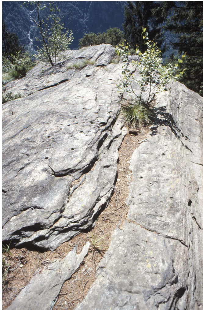
Gravuren auf dem nördlichen Teilblock