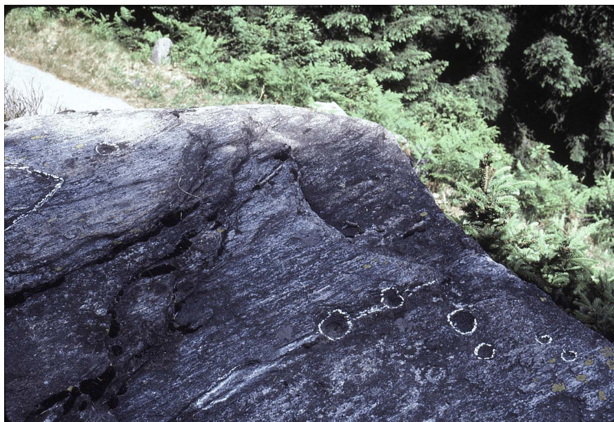
Abbildung : Binda F. 1985 und 1987 (Skizze)

Bibliographie : Binda F. 1985 - 3, 52; Binda F. 1987 - 1, Nr.140