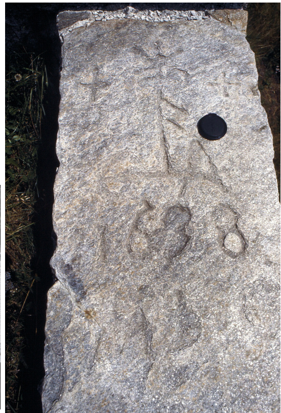
Foto de Platte auf der Abschlussmauer