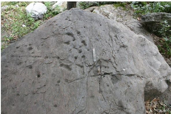
Foto der nordöstlichen Ebene, 2004