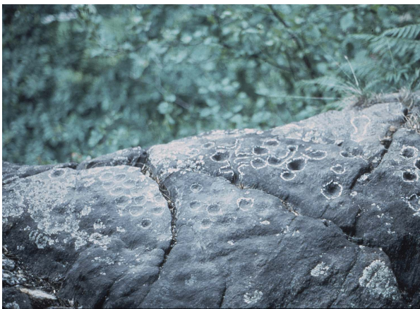
Abbildung : Binda 1985 - 1, Foto; Binda 1985 - 3, 13 (Zeichnung), 14 (Foto)

Bibliographie : Binda F. 1985 - 1; Binda F. 1985 - 3, 13 f.; Binda F. 1987 - 1, Nr. 103; Binda F. 1996, 160.