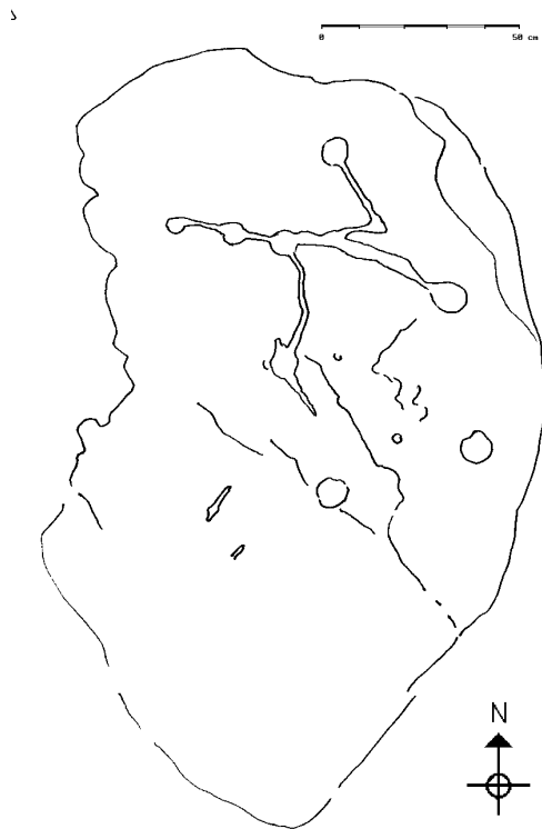
Zeichnung nach Kopie mit Plasticfolie 1987