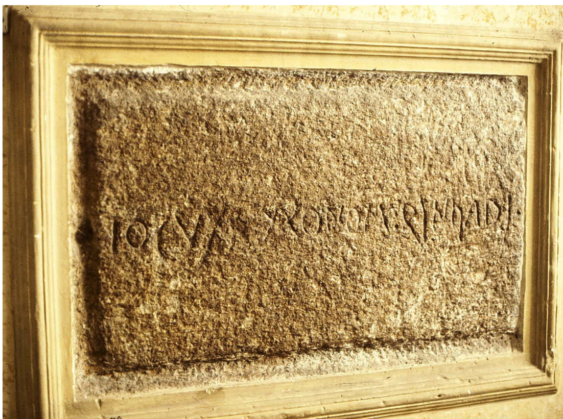
Foto der Platte 1982