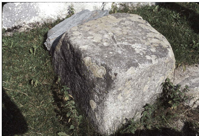
Abbildung : Büchi 1983, 24, Fig.4, 25, Foto 7.

Bibliographie : Liniger H. 1970, 6 (Objekt 42); Büchi U. und G. 1983, 24 - 27; Büchi U. und G., Cathomen I. 1990, 102.