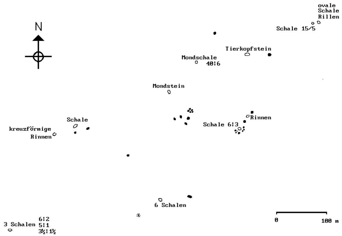
Übersichtsplan über das Gebiet Pardi bei Falera.