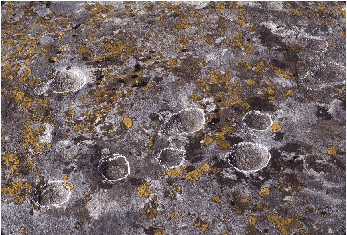
Platta dil vin