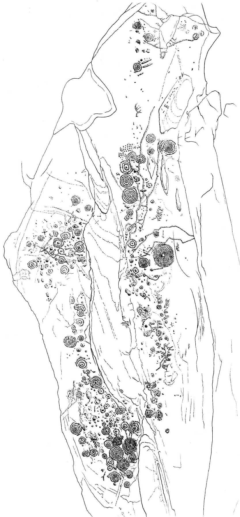
Zeichnung: Brigitte Gubler