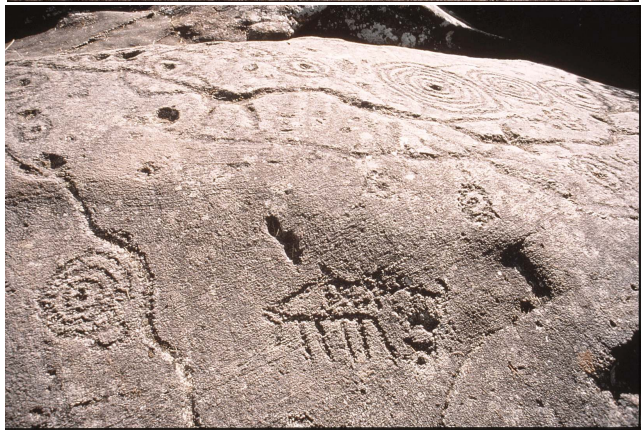
Carschenna, Platte II