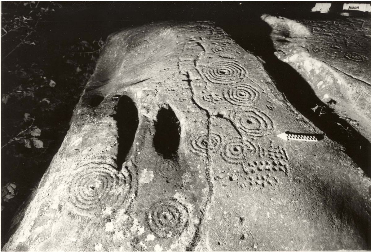
Gruppierte Schalen auf Platte II