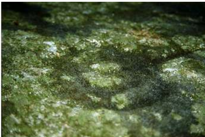
Abbildung : Rageth J. 1997, 132 (Zeichnung und Foto); 81.JbSGUF 1998, 275, Abb.10.

Bibliographie : Rageth J.1997, HA 28/Nr.111/112, 131-133; 81.JbSGUF 1998, 275.