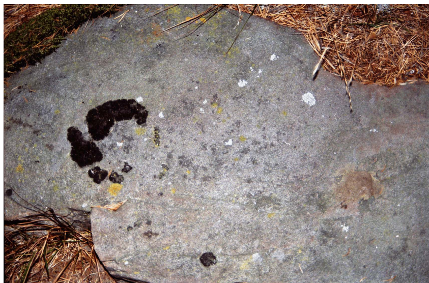
Abbildung : Rageth J. 1997, 133 (Zeichnung und Foto)

Bibliographie : Rageth J.1997, HA 28/Nr.111/112, 131-133; 81.JbSGUF 1998, 275.