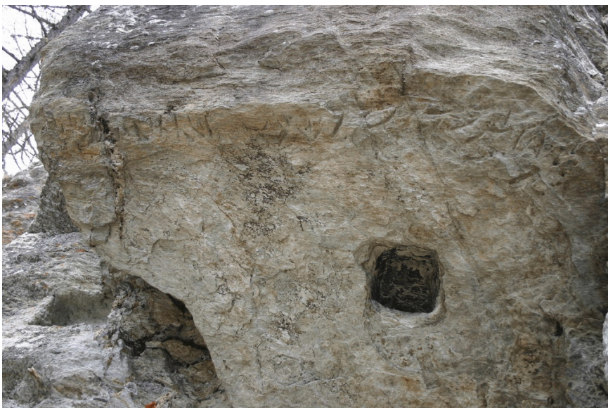
Pfostenloch und Inschrift