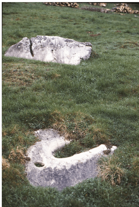
Abbildung : Koby 260 (Foto Fig.14), 261 (Zeichnung Fig.15), 262 (Foto Fig.16)

Bibliographie : Koby F.E. 1947a, 122-126 ; Koby F.E. 1947b, 248 f., 260-262 ; 39.JbSGU 1948, 102 f. ; Spahni J.-C. 1950c, 34.