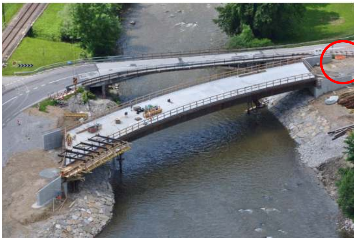
Foto vom 8. Juni 2015 aus der oben genannten Botschaft mit dem ehemaligen Standort des Distanzsteins

Siehe auch: Übersicht Distanzsteine Luzern