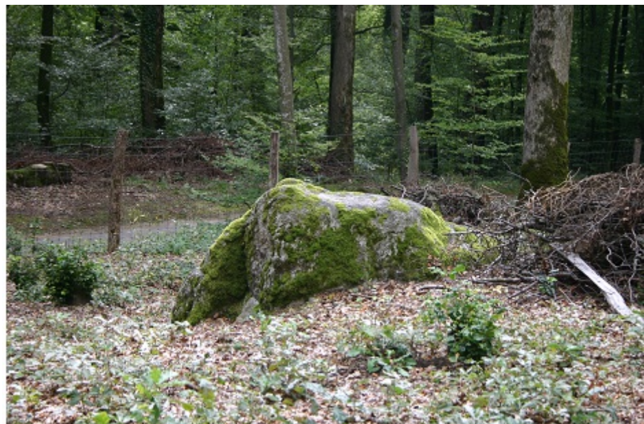
Erhaltener Block 'A' ?