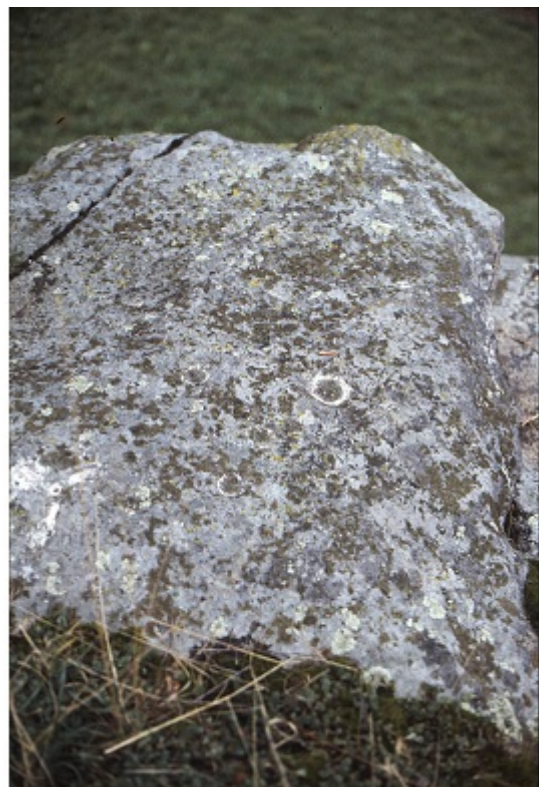
Abbildung : Vauthier 248 (Skizze des Steins und der Schalen)

Bibliographie : Vouga D. 1943. Carte archéologique du canton den Neuchâtel ; Vauthier B. 1985b, 26, 248; P.Mitt. R. Biner (2004).