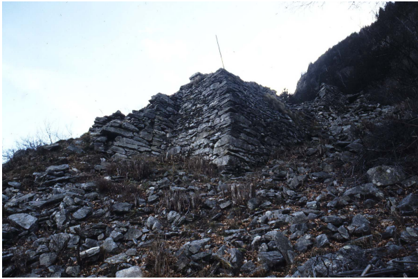
Mauer bei 1