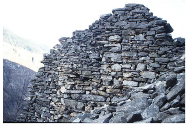
Mauer mit Trennfuge bei 2