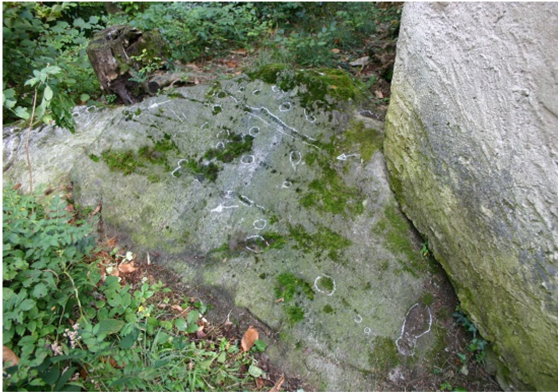
Eine Schale liegt unter dem Fundament der Kapelle (oben)