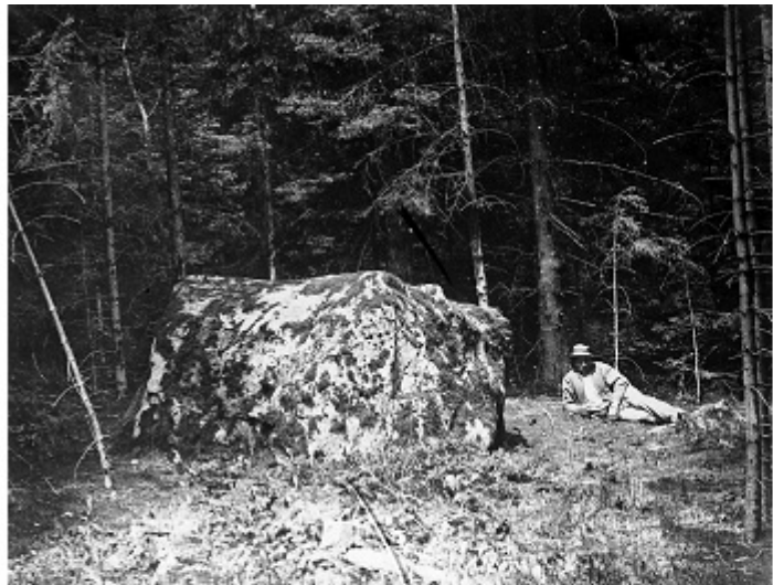
La Pierre à Phébou. Foto von Vionnet von 1871.

Der Block trägt mindestens 75 Schalen, unter Einbezug der zweifelhaften Vertiefungen über 100 Schalen und 2 Bohrlöcher. Einige Zweiergruppen von Schalen durch Rinnen verbunden. Die von Vionnet gezeichneten Rinnen sind heute wenig eindeutig sichtbar; die von Vionnet angegebene Himmelsrichtung ist offensichtlich falsch.