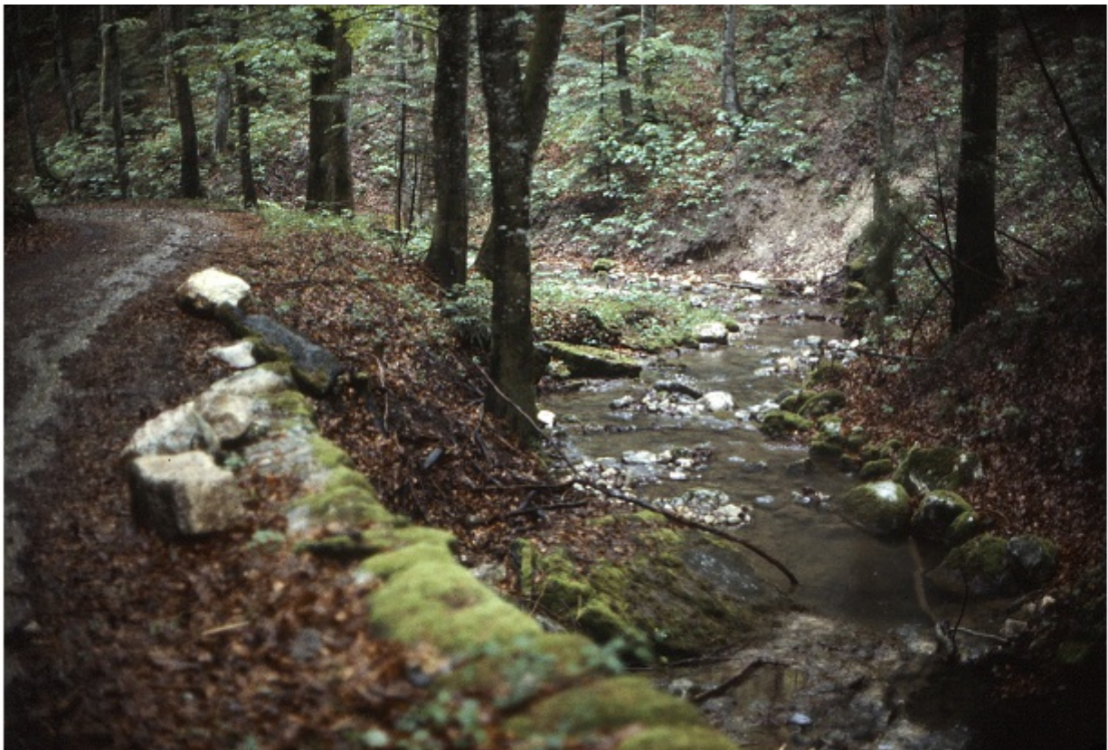
Gleiche Situation 1982.