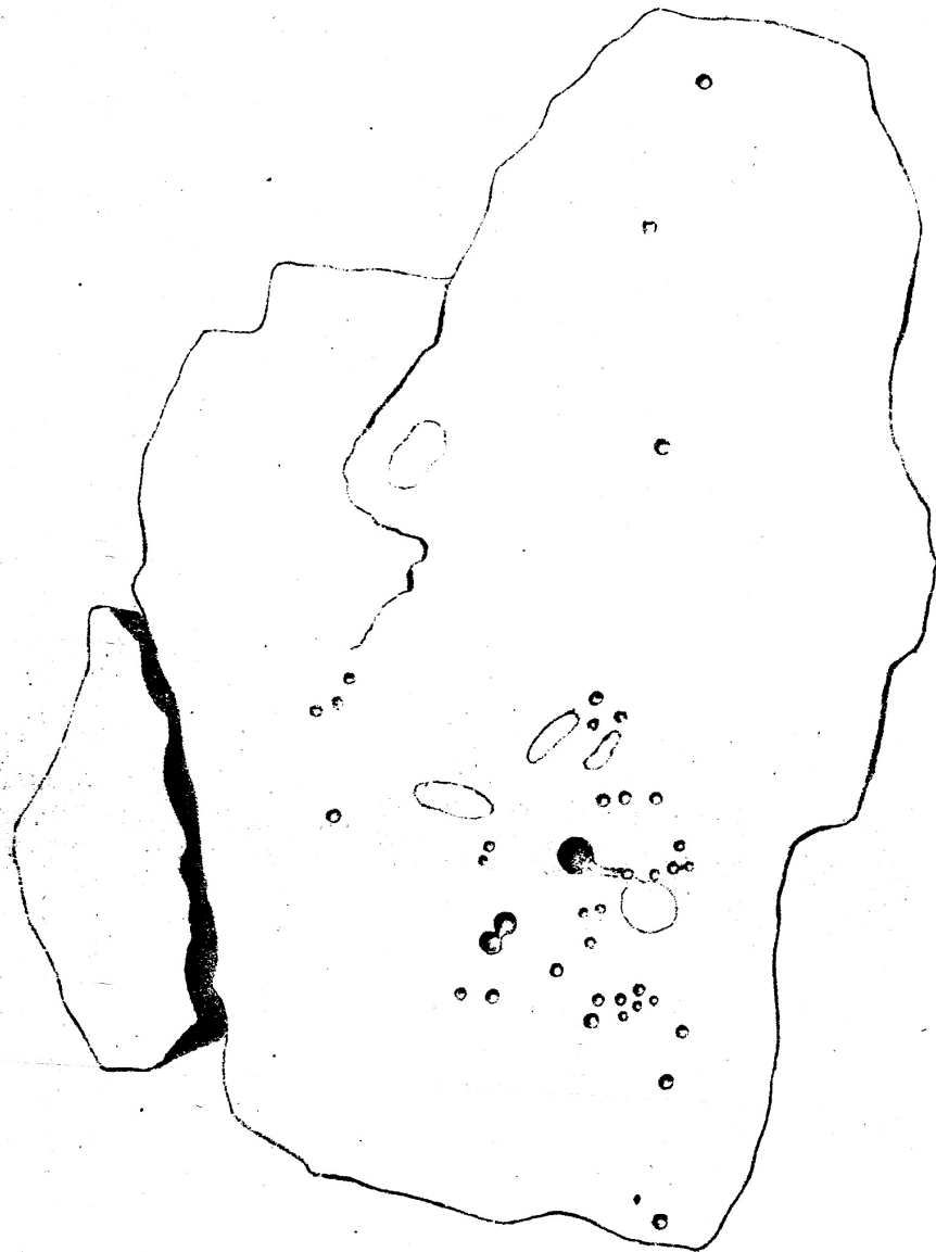
Schalenbild. Zeichnung von Vionnet 1872