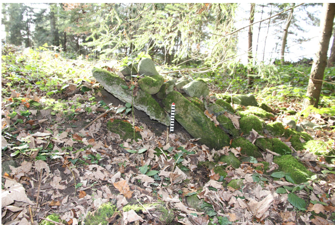
schief liegende Platten mit Rollsteinen

Aus dem Waldstück 'Pfad' westlich der Strasse (Fotos 2014):