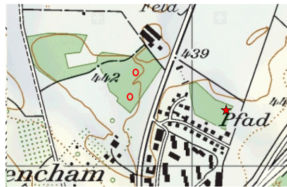
Landeskarte der Schweiz 1:25'000

Mitteilung im 26. JbSGU 1934, 93: Im Wäldchen P f a d r ü t i sieben stehende Findlinge in zwei Parallelreihen. Umgebender Boden durchsetzt mit kleinern Sandsteinplatten und viel Geröll bis in 40cm Tiefe. Funde: Röhrenknochen, von K.Hescheler als Wolfoder großer Haushund bestimmt, etwas Holzkohle, bezw. angebranntes Holz. Mitt. M. Bütler.